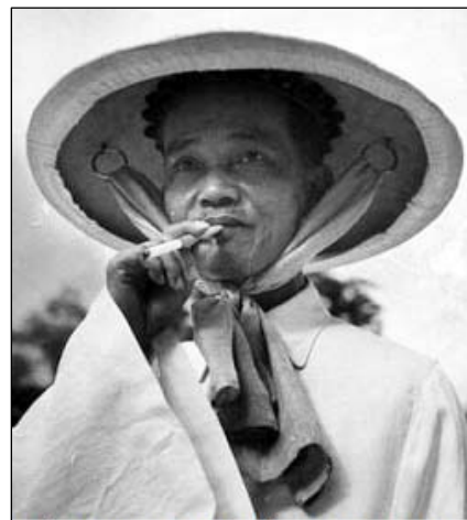
Ông Phạm Công Tắc Chủ Tịch Mặt Trận Thống Nhất Toàn Lực Quốc Gia