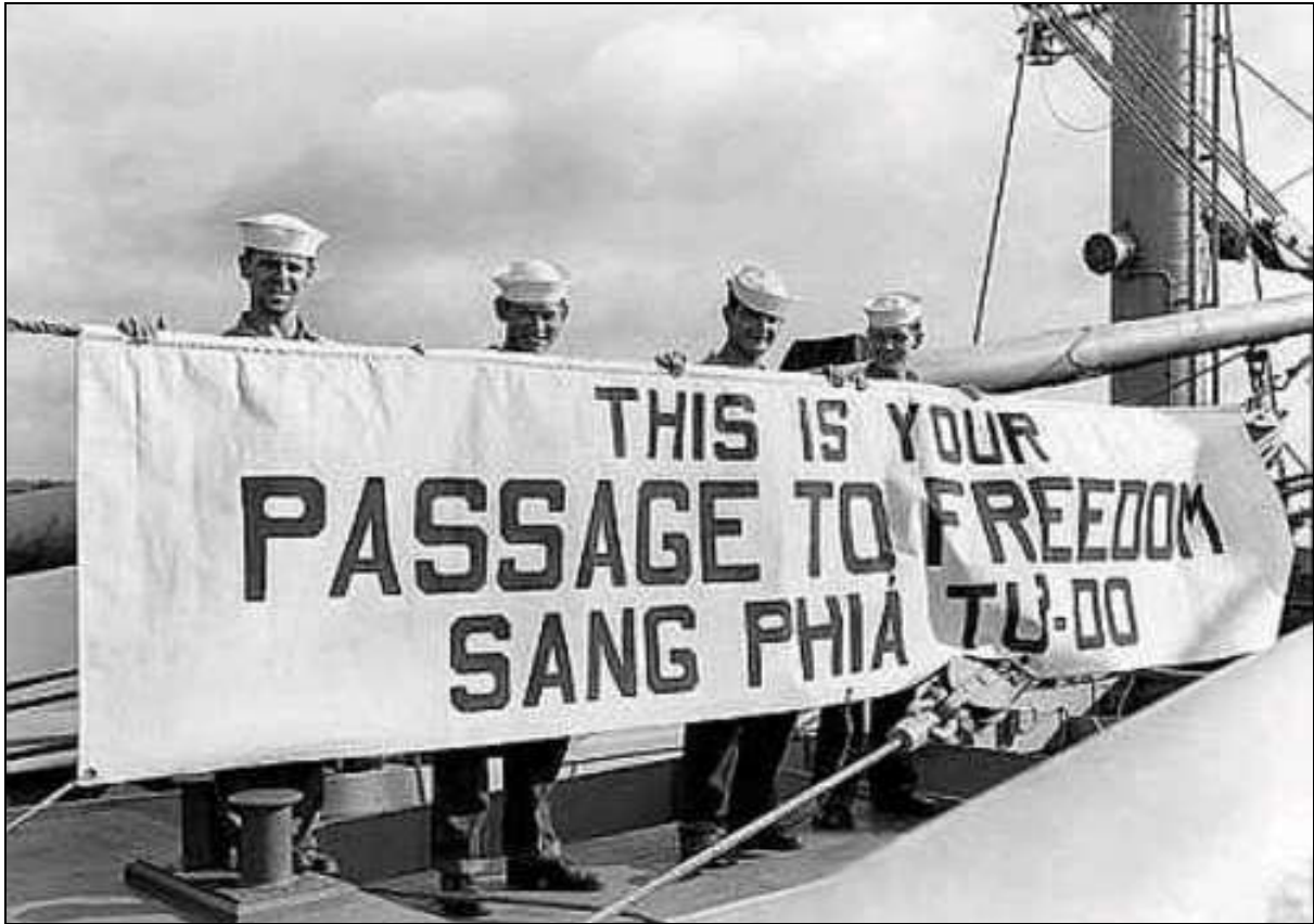
Passage to Freedom: Bốn lính Hải Quân Mỹ căng biểu ngữ đón chào người di cư lên chiến hạm USS Bayfield (APA-33) từ bến Hải Phòng để đi Saigon vào ngày 3-9-1954

Trong khi đó Tiểu đoàn 5 Nhảy Dù di chuyển từ Hải Phòng được chỉ định trấn đóng tại Đà Nẵng; cùng với 2 Tiểu đoàn 3, Tiểu đoàn 7 Nhảy Dù. di chuyển từ Hà Nội vào.