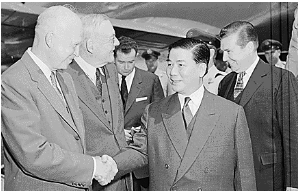
Tổng Thống Mỹ Dwight D. Eisenhower và Ngoại Trưởng John Foster Dulles ( left) tiếp đón Tổng Thống Ngô Đình Diệm tại Washington National Airport. 08/05/1957