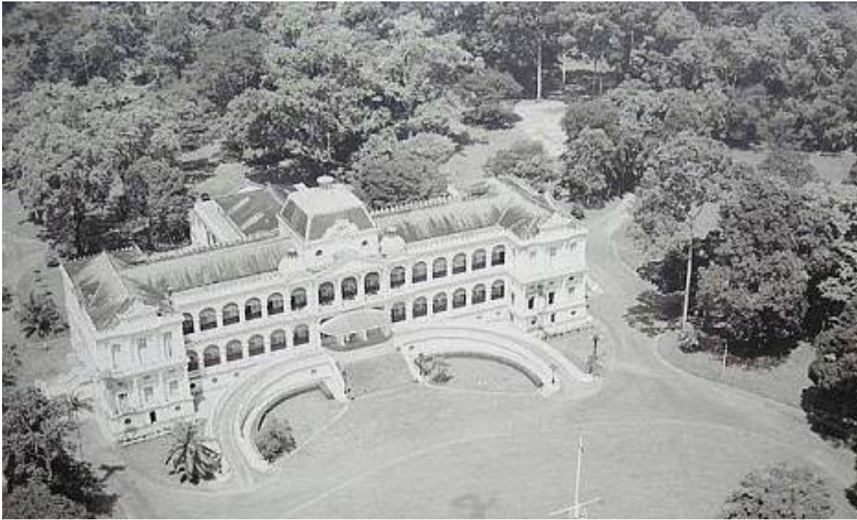
Dinh Độc Lập ngày xưa