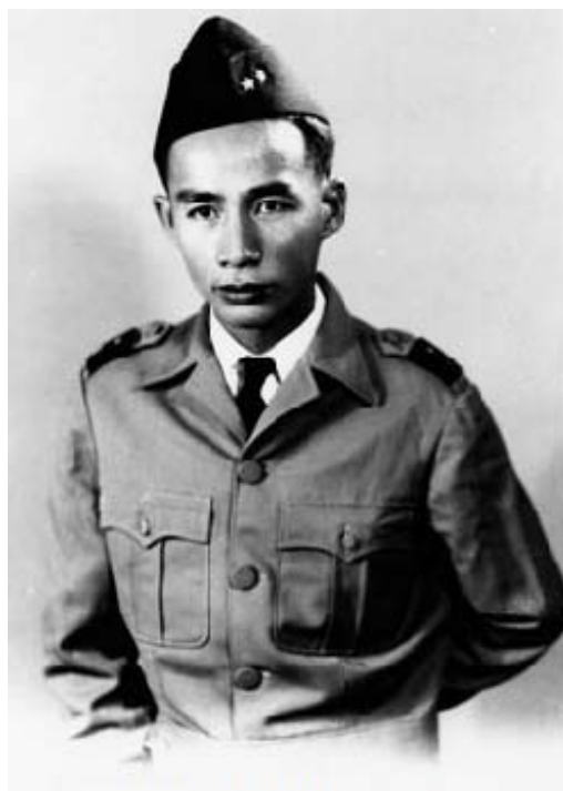
Tướng Trình Minh Thế